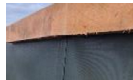
Fibernet til afdækning