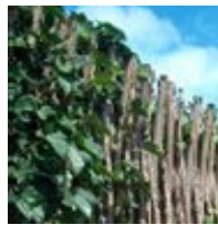
Pil med bark