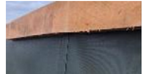
Fibernet som afdækning